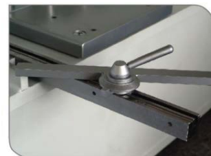
0-180° Adjustable Angel Stop