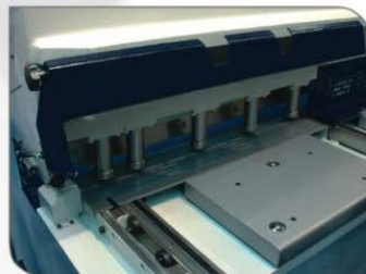
Swing Up Feature Of Front Guard