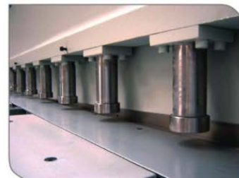
HSB 3006 Holddown Cylinders