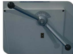
Blade Gap Adjustment