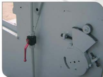
Double Cutting Speed Valve